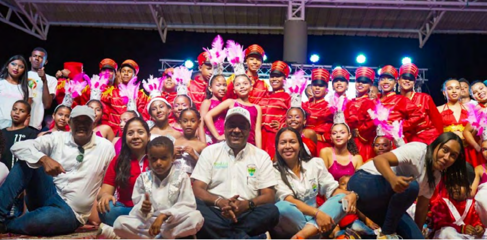
Un viaje de transformación integral: Dibulla, ejemplo de progreso en educación, deporte, cultura y compromiso social.

Cultura y Arte: VALORARTE, programa de formación artística y cultural, invierte $1,644,585,000 en formar integralmente a 2,000 personas en 9 disciplinas artísticas. Este programa no solo fomenta el arte sino que también contribuye al desarrollo psicosocial. La participación en eventos culturales y la entrega de instrumentos resaltan el impacto positivo en niños, jóvenes y adultos. Valorarte deja una huella en la cultura local, fortaleciendo valores, derechos y la identidad de la población.