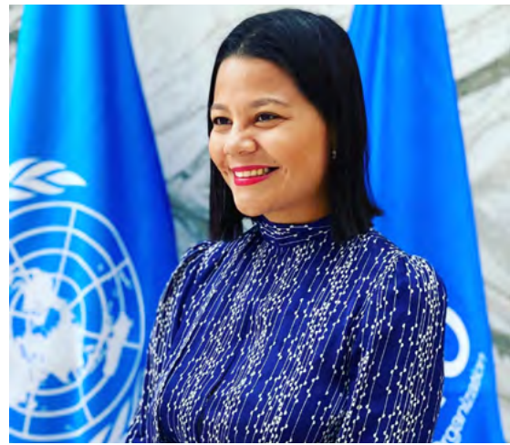
Su esencia colombiana y caribeña se fusiona con el compromiso de transformar el turismo en el sector más humano.