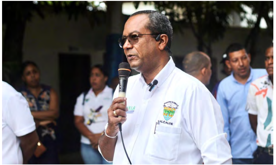
En una entrevista exclusiva, exploramos los hitos, retos y futuras aspiraciones, incluyendo la construcción del Centro Deportivo Cuatro Veredas.

Indiscutiblemente, en este periodo, el cambio en el gobierno nacional representa una gran dificultad para los mandatarios locales, ya que implica la pérdida de un tiempo crucial. No solo se trata del tiempo perdido debido a la pandemia, sino también de más de un año en el que se experimentaron dificultades para coordinarse con el gobierno nacional. Esta pérdida de tiempo es significativa, considerando que cuatro años pasan rápidamente, y enfrentar un cambio de gobierno a mitad de camino, con dos años restantes, sin duda se convierte en un obstáculo para que los mandatarios puedan llevar a cabo la gestión y ejecución de