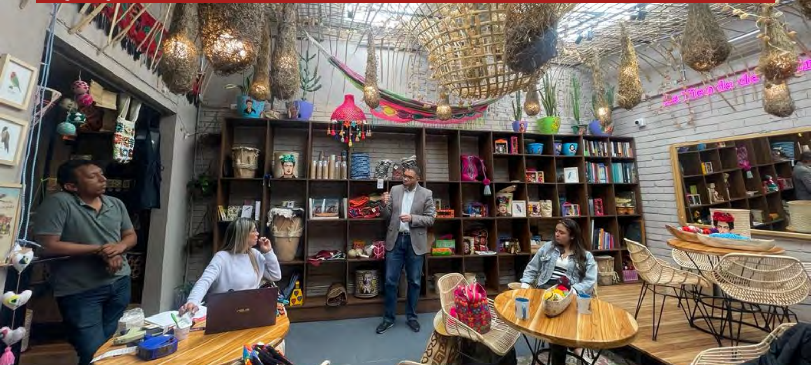
Espacios de la Tienda de la Empatía en la localidad de Usaquén en Bogotá.

realizó con la Fundación Semana como su directora durante 12 años, trabajando eventualmente también en algunas iniciativas y programas en el marco del postconflicto.