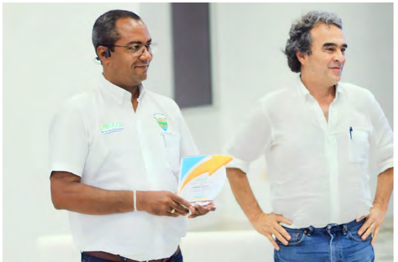
Desde una revolución educativa con participación en el Foro Educativo Nacional hasta convertirse en el municipio deportivo de La Guajira, el enfoque holístico de Dibulla abarca cultura, compromiso con la niñez y apoyo a la juventud emprendedora, con el acompañamiento de Sergio Fajardo.

Juventud Emprendedora: El municipio ha canalizado esfuerzos para fortalecer el sistema municipal de juventud, actualizando plataformas y consolidando el consejo municipal de juventudes. La celebración exitosa de la semana de la juventud evidencia el apoyo a emprendimientos juveniles y la promoción de oportunidades. La oferta institucional presentada destaca la visión proactiva hacia el crecimiento y bienestar de la juventud. Dibulla, a través de un enfoque holístico en educación, deporte, cultura, niñez y juventud, se erige como un ejemplo de transformación integral, impulsando el progreso y la identidad de su comunidad. A