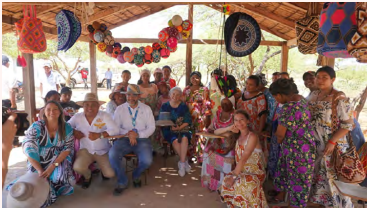
Taller de Tejeduría en Yotojorotshi.