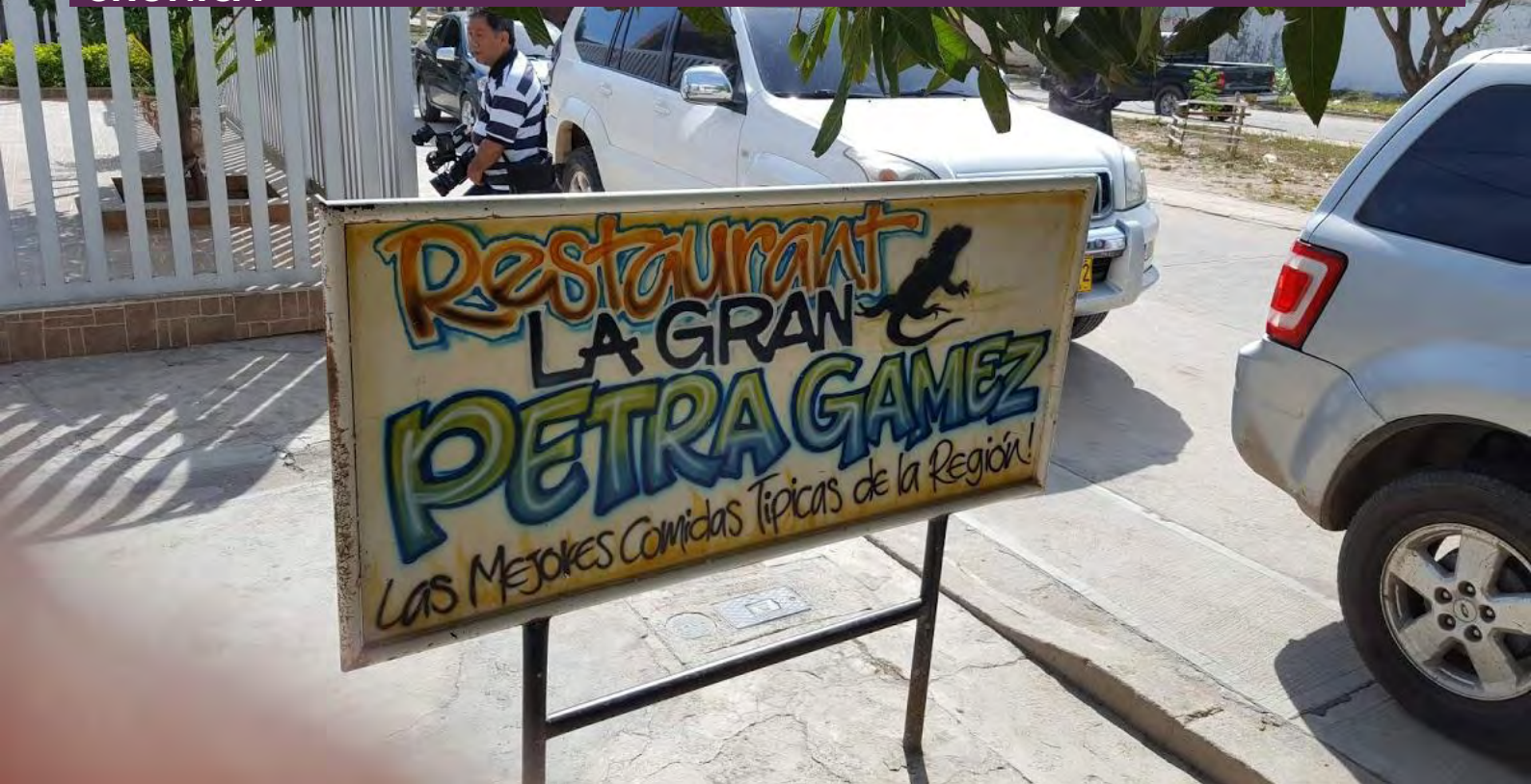
Restaurante la Gran Petra Gamez