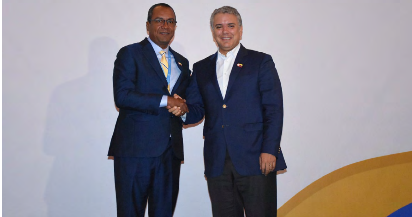
Marlon Amaya Mejía, alcalde de Dibulla junto al expresidente de Colombia, Iván Duque.

Indiscutiblemente, es imperativo dar continuidad a la apuesta que el gobierno de las oportunidades ha realizado en el deporte, particularmente en la adquisición de una buseta que permita contar con un transporte propio en el municipio. Este vehículo sería fundamental para trasladar a los niños, niñas y jóvenes deportistas desde los diferentes corregimientos hasta el Centro Deportivo Cuatro Veredas. Además, este mismo transporte posibilitaría la disposición y disponibilidad para desplazarse a otros departamentos, permitiendo así la participación activa del municipio de Dibulla en competencias a nivel departamental y nacional.