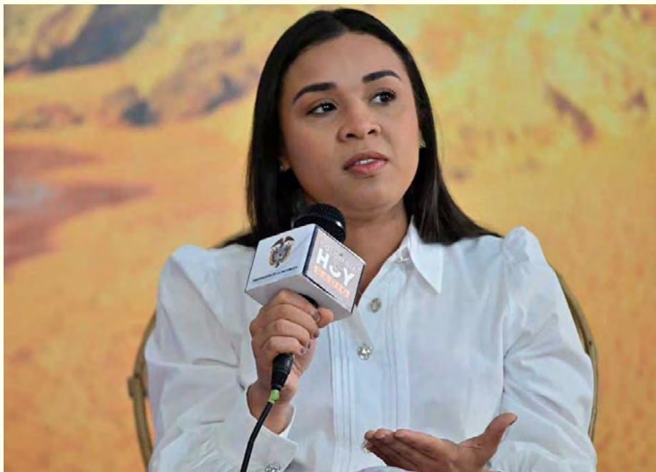
Diala Wilches Cortina, gobernadora de La Guajira, comparte los logros y desafíos de su gestión en la audiencia pública de Rendición de Cuentas 2022 – 2023.

Otros hitos en esta rendición de cuentas fueron el éxito del programa de Alimentación Escolar, planeación de PAE 2024 a tiempo y avances en salud que han impactado positivamente a comunidades indígenas. Se desplegaron 24 equipos por todos los municipios de mayor atención para contrarrestar el riesgo de desnutrición. Igualmente, se logró una alianza estratégica y exitosa