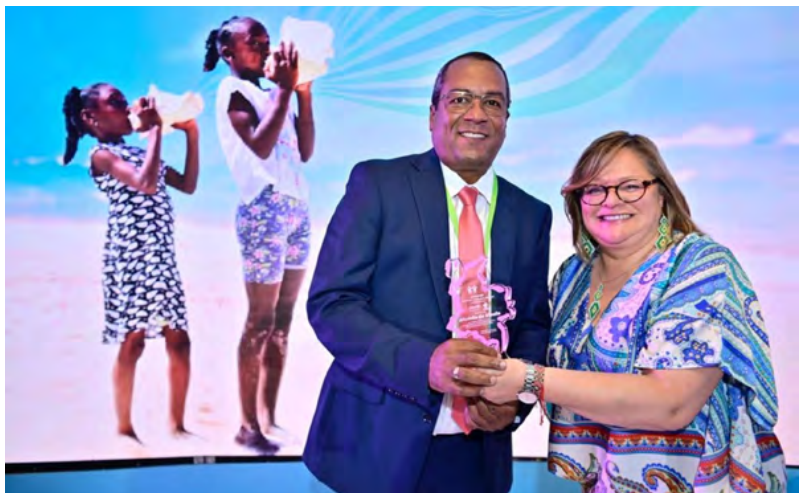
Dibulla Brilla en Educación, Deporte, Cultura y Compromiso Social.