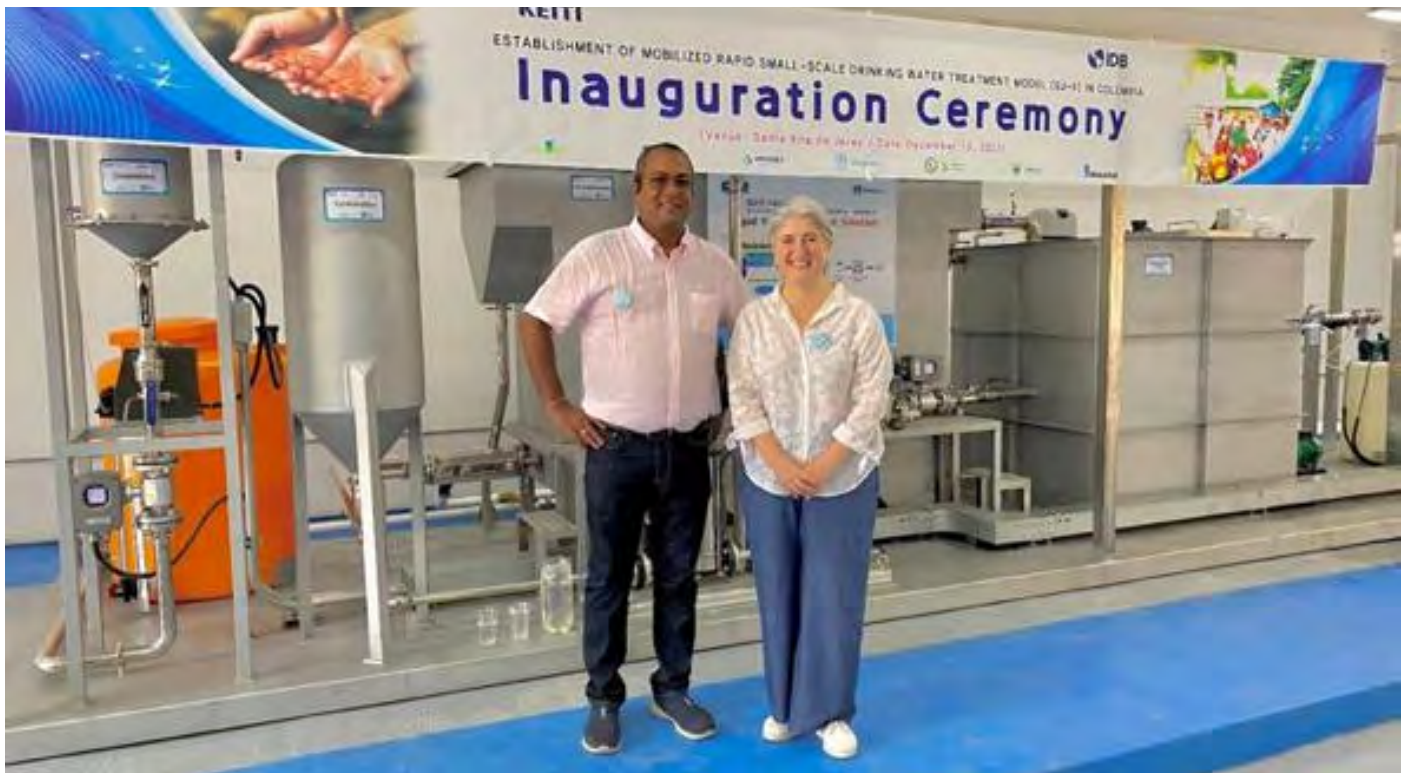
El alcalde Marlon Amaya Mejía junto a la Ministra de Vivienda, Ciudad y Territorio de Colombia, Catalina Velasco Campuzano