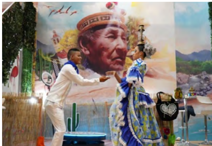
Con iniciativas innovadoras y colaboraciones estratégicas, Dibulla avanza hacia un futuro turístico brillante.