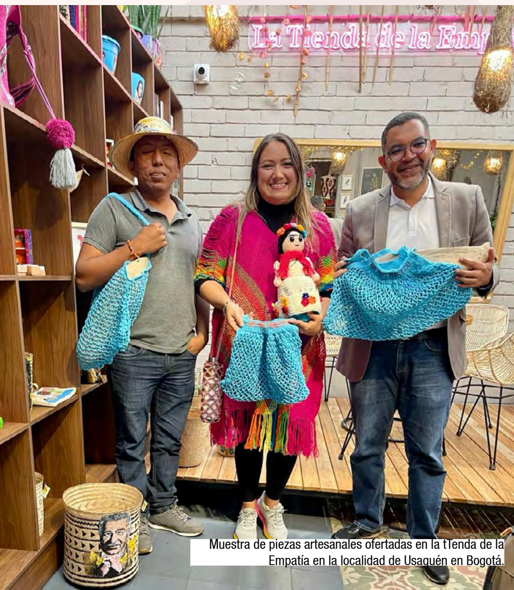
Muestra de piezas artesanales ofertadas en la tienda de la Empatía en la localidad de Usaquén en Bogotá.

en cuenta las profundas necesidades de supervivencia, las cuales afloraban en medio de la pandemia. Allí identificó la posibilidad de ayudarles a vender sus productos fuera de sus lugares de origen en el marco de una relación basada en la empatía y el comercio justo. Así nació el espacio que hoy es el reservorio de su gran pasión, la causa que moviliza su fuerza y el espacio sagrado donde convergen las expresiones artísticas de las colectividades con las que, con un inmenso sentido de respeto, reconocimiento con su talento y compromiso con su bienestar integral, trabaja arduamente: La Tienda de la Empatía. Sobre el papel de las mujeres en las regiones del país expresa: “Para mí el feminismo tiene que ver también con la forma cómo la mano cuidadora de la mujer permite que se teja, que se reconstruya, que se teja alrededor de la vida, y esas son improntas indispensables para la reconciliación, la seguridad y la paz” . Su voz y su mirada se tornan más cálidas aún cuando habla de lo que ha visto y percibido sobre la maternidad en esas zonas: “Admiro profundamente a las madres cabeza de hogar, que es lo que veo permanentemente en las ciudades y en los territorios, y de cómo ejercen esa labor de echarse los hijos al hombro, y cómo una madre convierte eso en su mejor herramienta y plataforma para echar para adelante” .