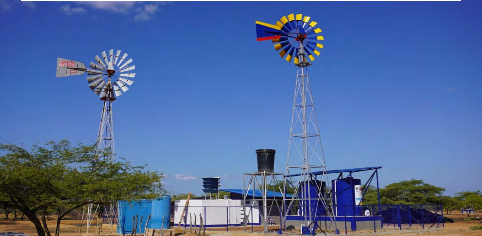
Sistema de abastecimiento de agua potable en Yotojorotshi.