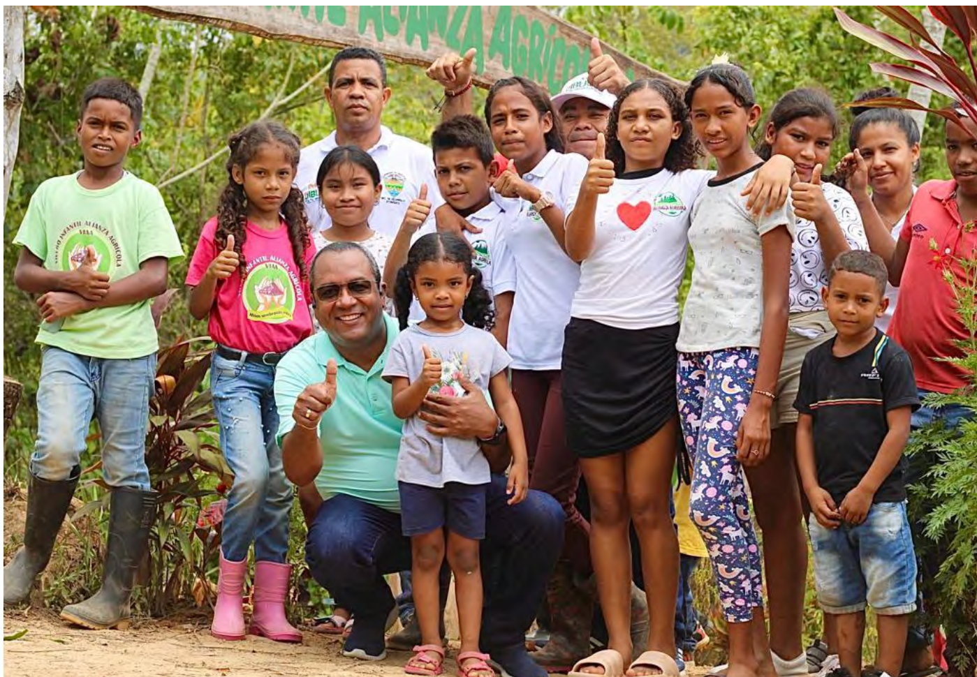
Un compromiso firme con la sostenibilidad, la equidad y el desarrollo económico que marca la diferencia en el bienestar de la comunidad durante el cuatrienio.