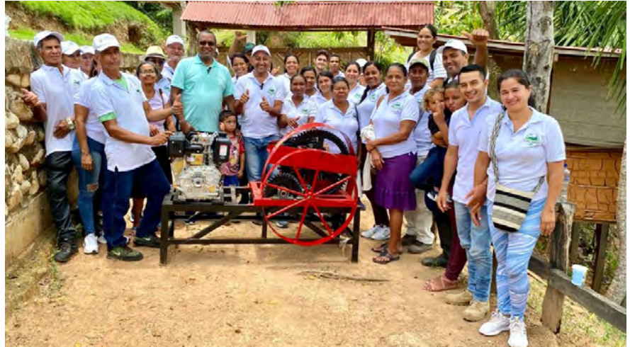
Desde el fortalecimiento de emprendimientos de mujeres rurales hasta el control del pez León y la apertura de la oficina del ICA, la gestión integral abarca dimensiones económicas, ambientales y de gestión.

3. Reforestación: Más de 3000 árboles se plantaron para proteger la cuenca del río Lagartos en la vereda El Mamey, y más de 1000 árboles se